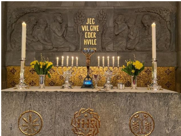
Påskepyntet alter i Frogner.

Det har vore ei fin påskehøgtid i Frogner med god oppslutnad om gudstenestene. No held påsketida fram i kyrkja, og førstkomande søndag er preiketekst henta frå fortellinga om då Jesus viste seg for nokre av disiplane ved Tiberiassjøen (Joh 21,1-14).