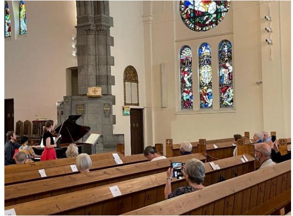
Eksklusiv konsert for de 20 som slapp inn.

Leder av Kulturutvalget i Frogner menighet