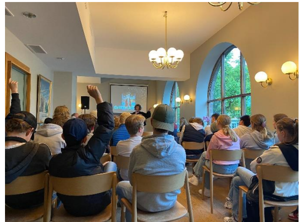
Grill en biskop!

Men tirsdagen var ikke ferdig med det. Vi fikk en guida rundtur i Frogner kirke, og kirkevergen hørte og tok imot ønsket om å få satt opp et enkelt kjøkken ved inngangen, slik at for eksempel en enkel kirkekaffe kan deles der, samt behovet for å ha ei tett glassdør, slik at kirka kan fremstå som åpen – uten at varme lekker ut. Vi var oppe på galleriet, og fikk høre det store spennet av lyd og følelser i det engelske orgelet, som har blitt en sånn nyvunnen rikdom for denne kirka. Vi beundra kirkekunsten, og det slo oss hvor spesielt det er, å kunne gå inne i kirka, midt i tett befolka Oslo, i fred og ro.