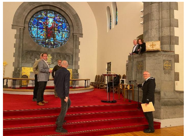
Inspeksjon i Frogner kirke.

Jeg hørte denne uka at dere omtalte dette forsøket som vellykka. Jeg vil oppfordre dere til å arbeide videre for å holde Frogner kirke åpen, også i noen tider når det ikke er seremonier. Dere har en unik beliggenhet. Bruk den.