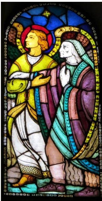
Detalj fra Per Vigelands glassmalerier.

SLIK GIKK DET! Jeg har levd så lenge at jeg har nådd refleksjonens år. Til det hører å tenke over eget liv. Hva ble det til? Hva har jeg, så langt, brukt livet mitt til? Jeg ser bakover på det som har vært. Jeg ser gode ting, som fyller meg med takknemlighet. Jeg ser vonde ting som jeg har forvoldt, eller som er gjort mot meg. Jeg ser ugjorte ting, tanker jeg skulle tenkt, gjerninger jeg skulle gjort. Hvordan skal jeg forholde meg til alt sammen? Jeg må forsones meg med mitt levde liv. Og med mitt ulevde liv.