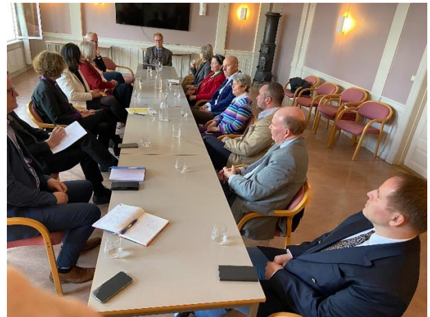
Biskopen møter menighetsrådet.

Torsdag hadde jeg en egen samtale om teologi og forkynnelse med de fire prestene i de to soknene, og jeg fikk være med på småbarnsang i kirkestua. Vi hadde en samtale i Frogner menighetsråd, og avslutta dagen med middag her i huset sammen med inviterte gjester fra Mariahuset, The American Lutheran Congregation, Kastanjen, Frogner kammerkor og Cæciliaforeningen.