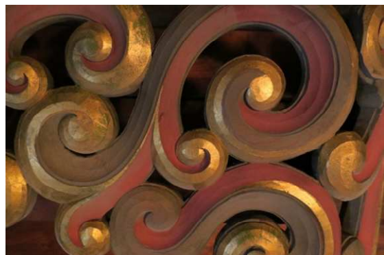
Detalj fra orgelefasaden i Frogner

Til slutt kommer det et sukk fra kirkeverten: «Jeg synes det er ille å dele ut de slitte brune putene på søndagene og skulle ønske at vi kunne få noen nye, pene puter».